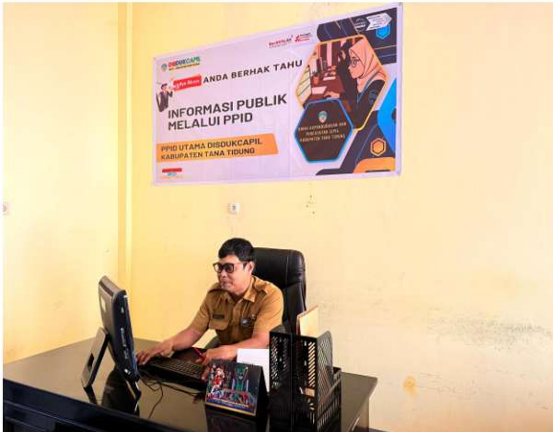
Gambar 2 Ruang Pelayanan Informasi Publik

Pelayanan langsung dilaksanakan melalui meja layanan Pejabat Pengelola Informasi dan Dokumentasi (PPID) yang tersedia di kantor Disdukcapil Kabupaten Tana Tidung. Melalui layanan ini, pemohon informasi dapat memperoleh penjelasan secara tatap muka, mengajukan permohonan informasi, serta berkonsultasi terkait jenis dan ketersediaan informasi yang dibutuhkan. Pelayanan langsung memberikan kejelasan dan kepastian bagi pemohon, terutama dalam hal informasi yang bersifat teknis dan membutuhkan penjelasan lebih lanjut.