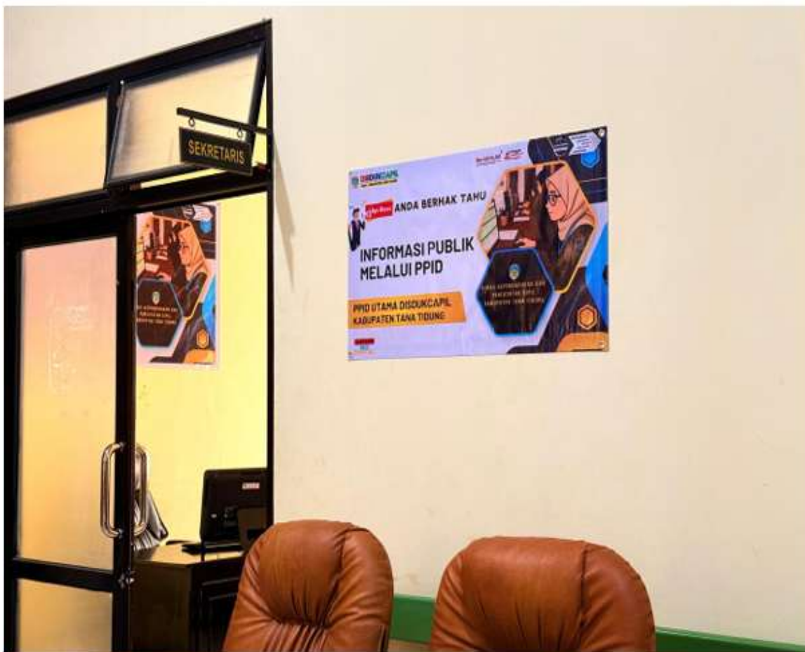
Gambar 1 Papan nama PPID Disdukcapil KTT

Pelayanan informasi publik di Dinas Kependudukan dan Pencatatan Sipil Kabupaten Tana Tidung dilaksanakan melalui mekanisme pelayanan langsung dan pelayanan tidak langsung sebagai bentuk komitmen dalam memberikan akses informasi yang luas, mudah, dan responsif kepada masyarakat. Pengaturan mekanisme ini bertujuan untuk mengakomodasi beragam kebutuhan dan kondisi pemohon informasi, sekaligus memastikan pelayanan informasi dapat menjangkau seluruh lapisan masyarakat.