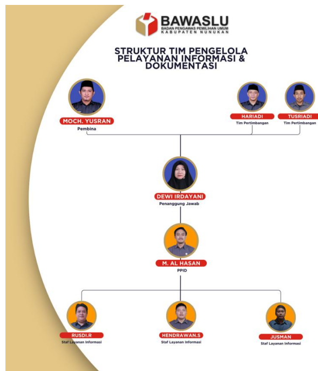
Gambar 1 Struktur PPID Bawaslu Kabupaten Nunukan

Bawaslu Kabupaten Nunukan telah menetapkan Struktur PPID yang nantinya bertugas dan bertanggung jawab dalam mengelola arus informasi kepada masyarakat. Struktur Organisasi PPID Bawaslu Kabuapten Nunukan tercantum dalam Surat Keputusan Bawaslu Kabupaten Nunukan Surat Keputusan Nomor 9/HM.00.02/K.KL-03/08/2025 Tentang Pembentukan Tim Keterbukaan Informasi Publik (KIP) Pejabat Pengelola Informasi Dan Dokumentasi Di Badan Pengawas Pemilihan Umum Kabupaten Nunukan Tahun 2025.