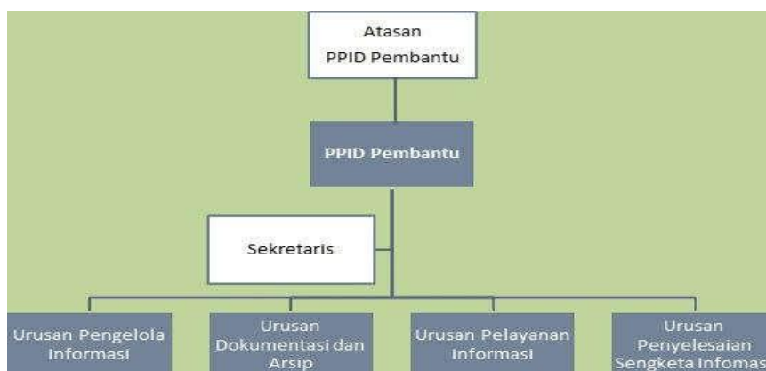
Gambar 1. Struktur Organisasi PPID Pembantu Dinas Perhubungan Kabupaten Tana Tidung (SK Ka. Dinas Perhubungan Kabupaten Tana Tidung Nomor 400.14.4.3/013/DISHUB/I/2025)